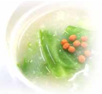
しっとりトロミも魅力！お米の白湯感覚すーぷ